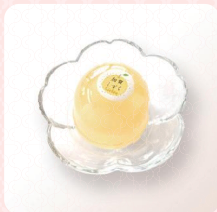
加賀しずくジュレ