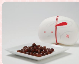
能登大納言甘納豆