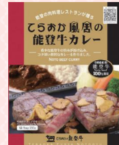
てらおか風舎の 能登牛カレー